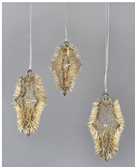
Nids d'oiseaux , 2020 Maurizio Galante et Tal Lancman Luminaire. Bronze, métal, verre Collection Les Aliénés , Mobilier national

L'œuvre s'appuie sur une lanterne, composée de quatre branches en plat contre-coudées fixant deux culots tournés et ciselés. L'élément inférieur porte un petit vase Médicis tourné formant bobèche, équipé d'une fausse bougie. L'élément supérieur est terminé par une graine et surmonté d'un anneau formant bélière.