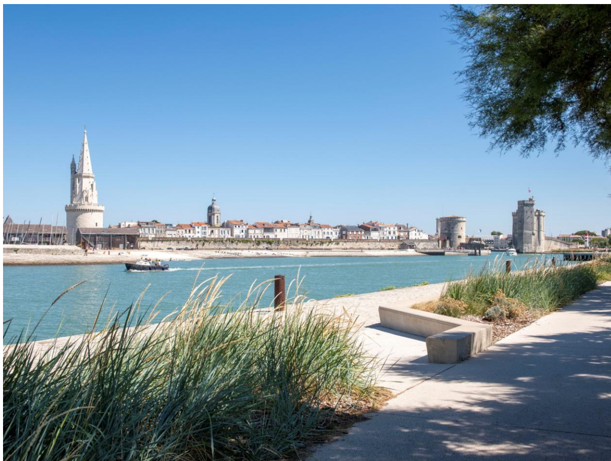
Tours de La Rochelle à l'embouchure du vieux port

Le Centre des monuments nationaux a pour mission d'entretenir, conserver et restaurer les monuments nationaux ainsi que leurs collections, dont il a la garde, d'en favoriser la connaissance, de les présenter au public et d'en développer la fréquentation.