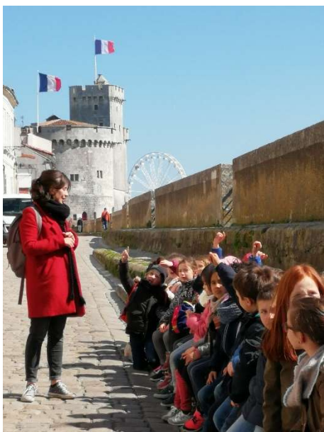
Légende : groupe assis sur la courtine de l'ancien rempart.

Précision : La courtine de l'ancien rempart permet de s'asseoir à proximité