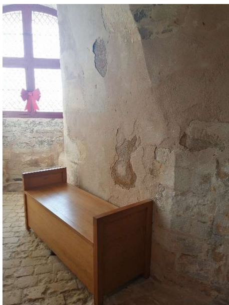
Légende : banc de repos dans le circuit de visite