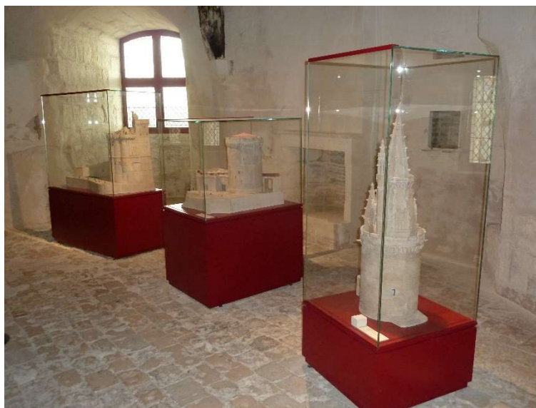
Légende : les maquettes en pierre des 3 tours

Précisions : Maquettes en pierre de chaque tour (Saint-Nicolas, Chaîne et Lanterne) sous vitrine, visible à 360°