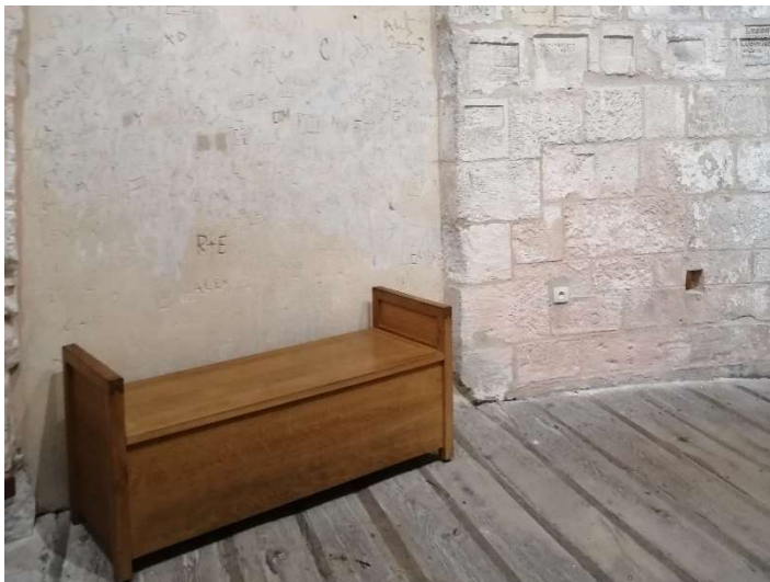
Légende : banc de repos dans le circuit de visite de la tour.

Des sièges ou des bancs sont situés à chaque niveau de la tour.