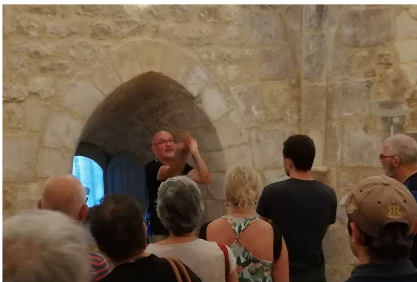
Légende : groupe en visite LSF

Précisions : pour les groupes, des visites tactiles, visite adaptée aux personnes déficientes intellectuelles, visite LSF, visite guidée à distance sont possibles