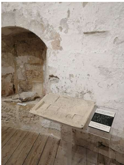
Légende : moulage tactile dans le circuit de visite