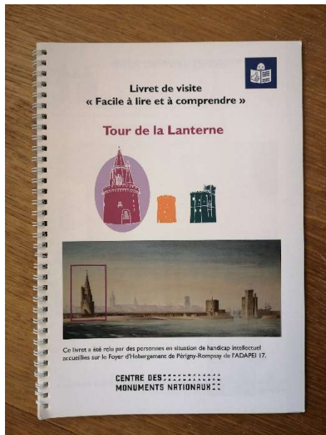
Légende : couverture du livret FALC