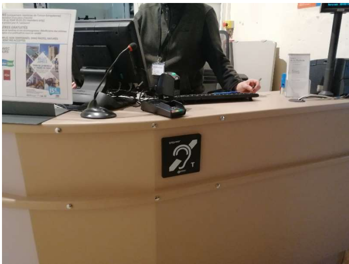
Légende : Boucle à induction magnétique de l'accueil de la tour de la Lanterne

Une boucle à induction magnétique est installée au niveau de la banque d'accueil