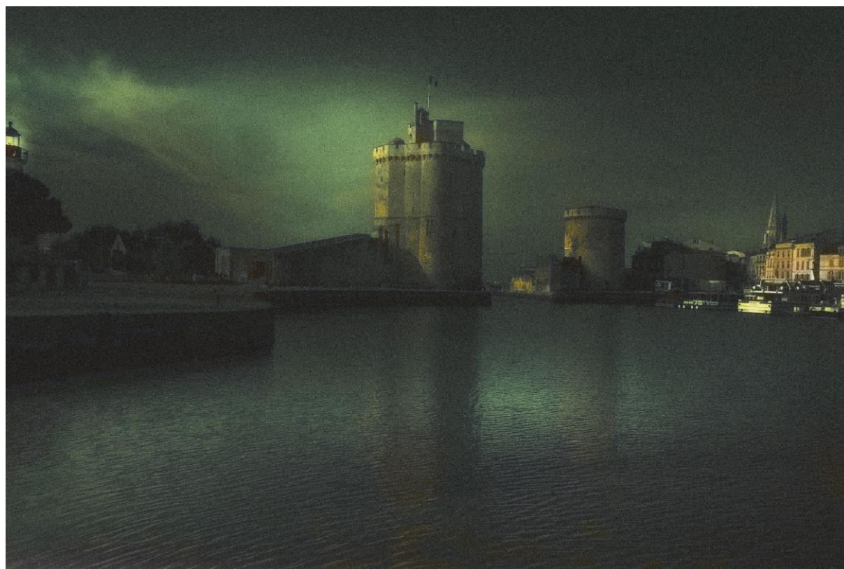
La repentie. Port de La Rochelle, Aunis