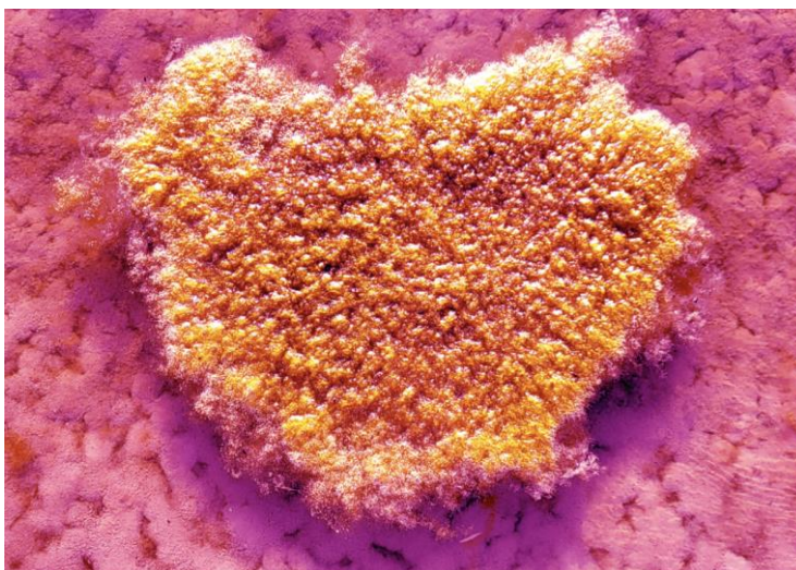
Laurent-David Garnier, SAU, 2023, photographie © ADAGP Paris / Œuvre financée par le programme du soutien à la création artistique Mondes nouveaux mis en œuvre par le ministère de la Culture dans le cadre de France Relance. / Production déléguée : Centre des monuments nationaux.