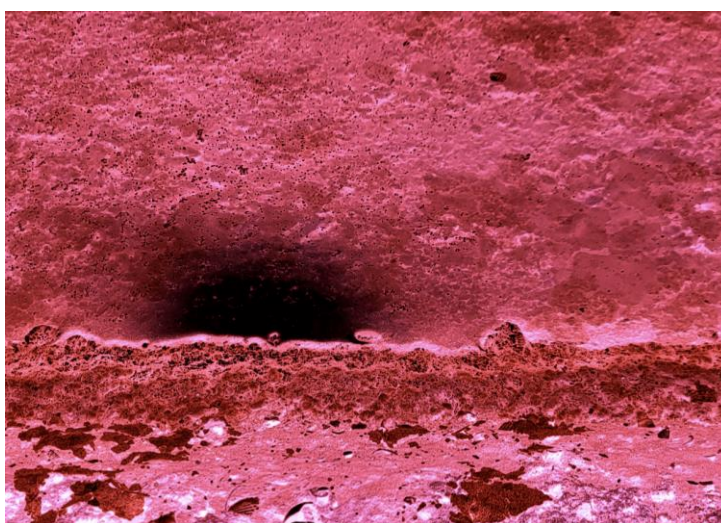
Laurent-David Garnier, SAU, 2023, photographie © ADAGP Paris / Œuvre financée par le programme du soutien à la création artistique Mondes nouveaux mis en œuvre par le ministère de la Culture dans le cadre de France Relance. Production déléguée : Centre des monuments nationaux.