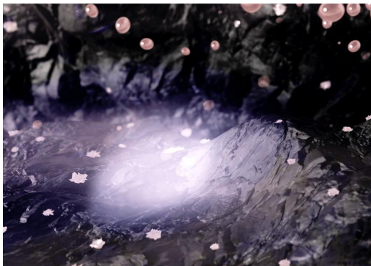
Laurent-David Garnier, SAU, 2023, vidéo (capture d'écran) © ADAGP Paris / Œuvre financée par le programme du soutien à la création artistique Mondes nouveaux mis en œuvre par le ministère de la Culture dans le cadre de France Relance. Production déléguée : Centre des monuments nationaux.